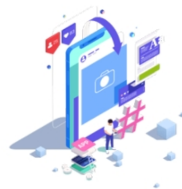
消費者向けアプリケーション システム運用保守