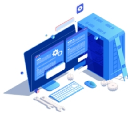
デスクトップ運用 保守