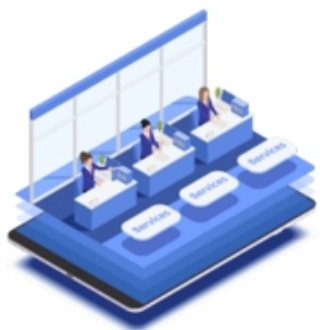
カスタマーセンターソリューション