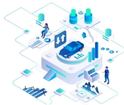
デジタルオペレーション ソリューション